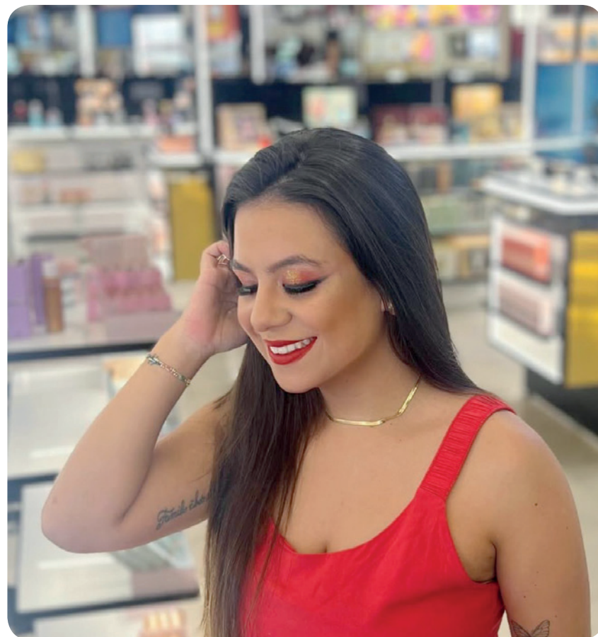
Alta pigmentação e variedade de cores para criar produções vibrantes e cheias de personalidade no Carnaval.