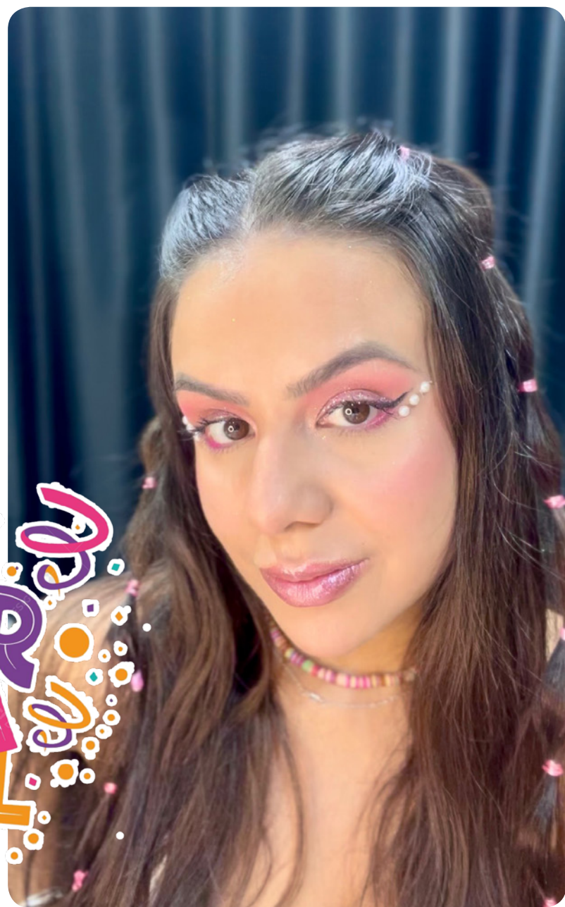
Pedrarias seguem em alta e transformam a maquiagem em destaque carnavalesco.

No rosto, bases leves ou de alta cobertura, conforme a preferência devem ser aplicadas sobre a pele bem preparada. A técnica de colorimetria também ganha espaço, permitindo corrigir imperfeições e uniformizar o tom antes da aplicação dos produtos iluminados e pigmentados.