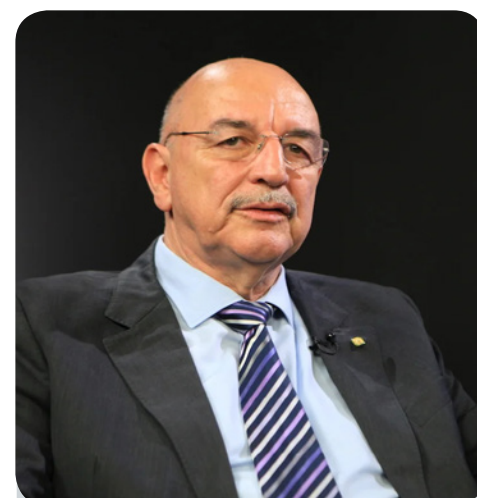
18 de fevereiro Deputado Osmar Gasparini Terra