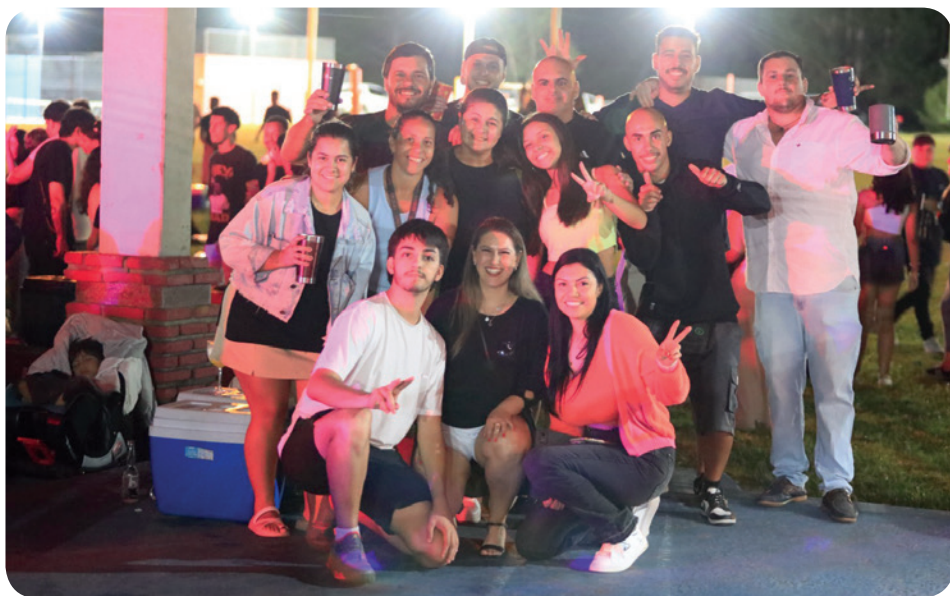
Entre sorrisos e muita animação, o público aproveita ao som do Pagode no Beat, a energia que embala e anima as noites do Clube Caixeiral.