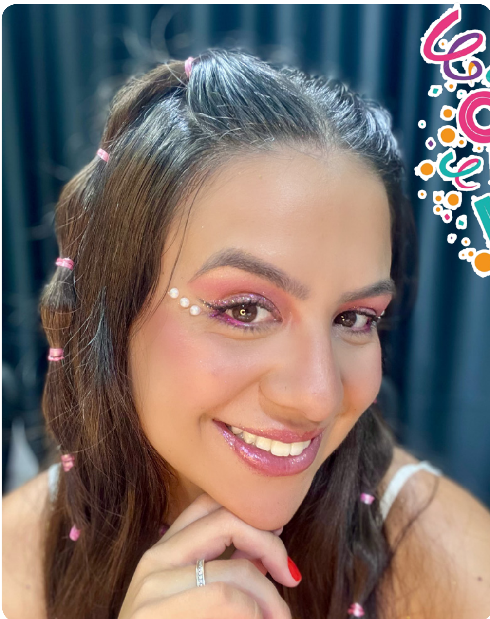
Limpeza, hidratação e primer são etapas essenciais para garantir maior durabilidade da maquiagem.