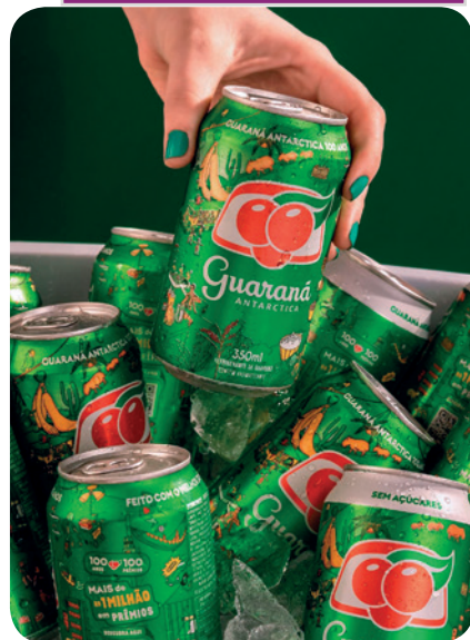
Economia na compra em pack é um dos diferenciais da campanha.

Recofrán: a escolha certa para manter a "gelada" garantida durante toda a folia.