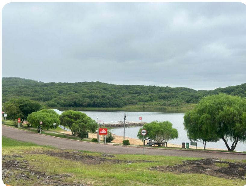
Parque Gran Bretaña