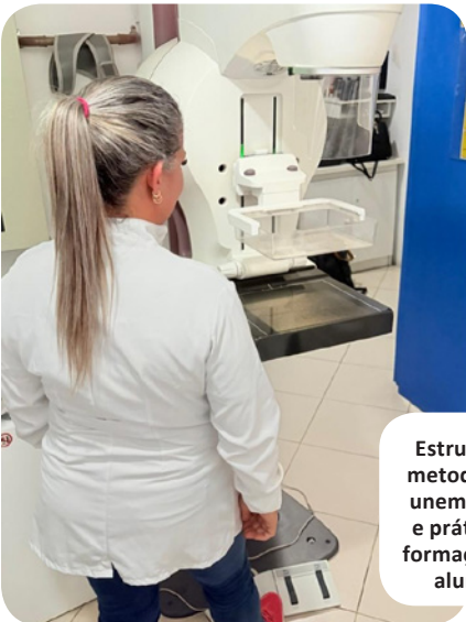
Estrutura e metodologia unem teoria e prática na formação dos alunos.