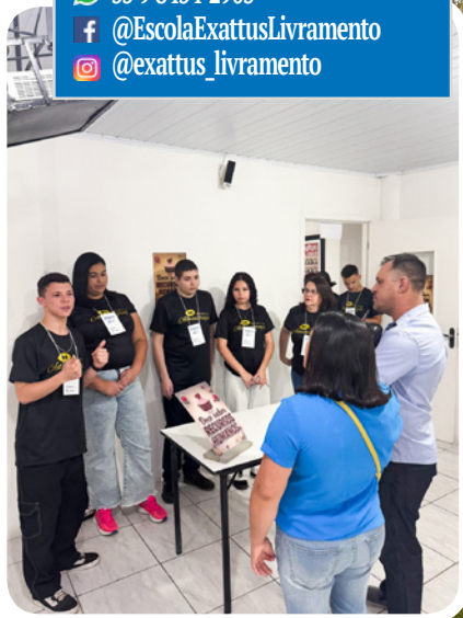
Corpo docente qualificado contribui para a preparação de profissionais.

Rua Conde de Porto Alegre, nº 841 3244-5354 | 3244-3132 55 9 8454-2905 @EscolaExattusLivramento @exattus_livramento