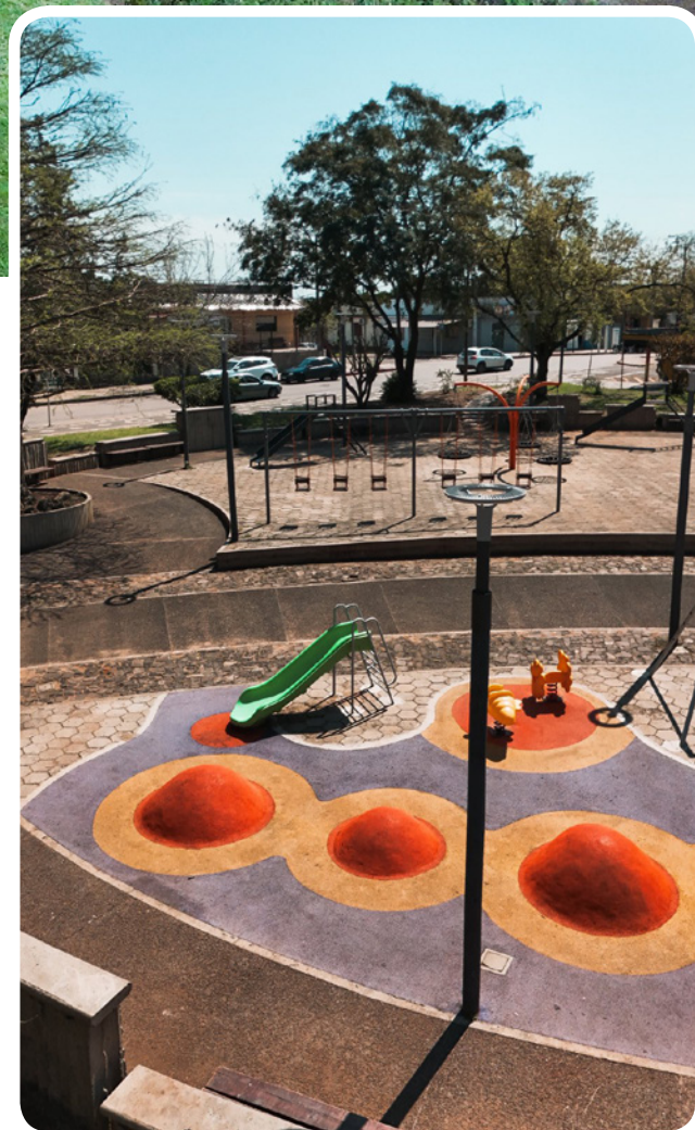
Praça 18 de Julio

Praças, avenidas, parques e rotas históricas são elementos fundamentais para compreender Rivera. Eles organizam a vida urbana, preservam a memória coletiva e impulsionam o desenvolvimento econômico e turístico. Ao investir na revitalização e valorização desses espaços, Rivera reafirma sua identidade fronteiriça e seu compromisso com a qualidade de vida da população.