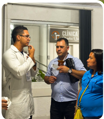
Educação como caminho para novas oportunidades pessoais e profissionais.