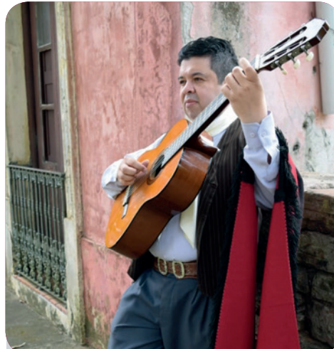
23 de janeiro - Músico Cristiano Cesarino