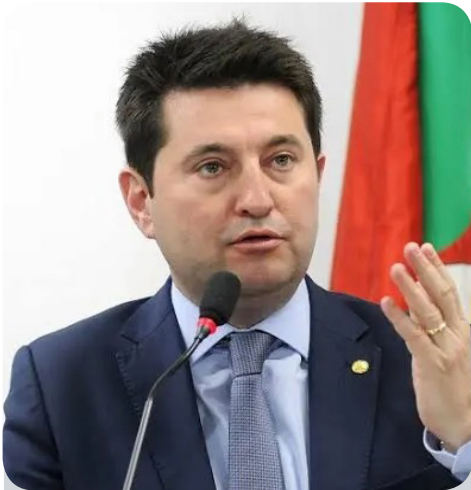
20 de janeiro - Advogado e ex-deputado Federal Jerônimo Goergen