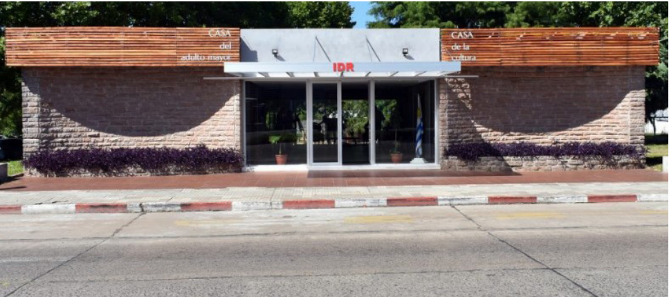
Casa de la Cultura Rivera

Horario de atención de lunes a viernes de 8:15 a 15 horas La División Cultura de la Intendencia Departamental de Rivera informa que se encuentran abiertas las inscripciones para los talleres que se dictarán en la Casa de la Cultura durante el año 2026. Talleres disponibles Ballet Folklórico De- partamental, Grupo de niños a partir de 8 años y grupo de adultos, Iniciación Musical (Guitarra), a partir de 10 años y el interesado deberá concurrir con su instrumento. A partir de 14 años, Escuela Departamental de Tango, Taller de Teatro, Taller de Canto, Taller Literario “Brin- dis Agreste”. Las personas interesadas en participar de las diferentes propuestas culturales, podrán realizar consultas e inscribirse a través del teléfono 462-39877, WhatsApp: +598 98 386 392. Horario de atención de lunes a viernes de 8:15 a 15 horas.