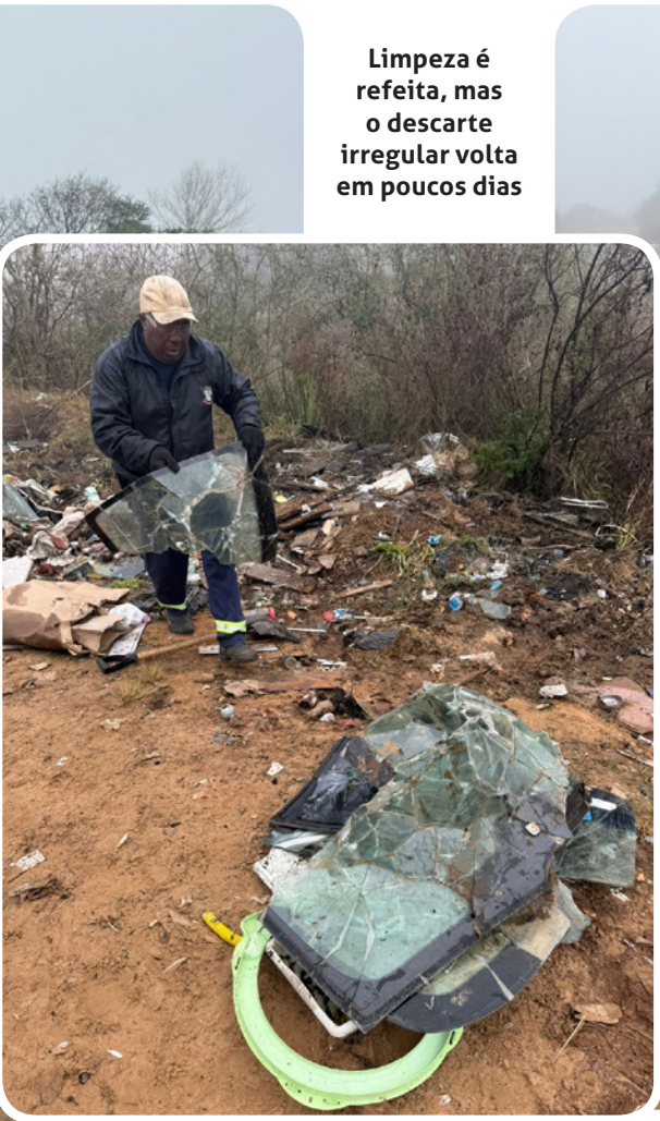
Limpeza é refeita, mas o descarte irregular volta em poucos dias