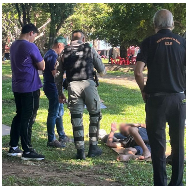
Fiscalización de personas en espacio público

Tras un trabajo de coordinación llevada adelante, fueron parte del mencionado operativo la Inspección General