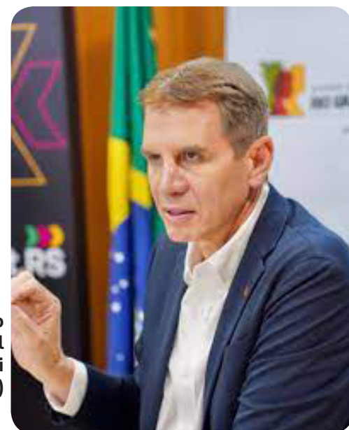
Deputado estadual Ernani Polo (PP)

lítico e construir convergências em torno de um programa de governo.