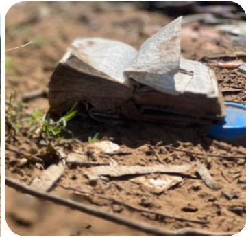
Lago Batuva transformado em depósito ilegal de lixo