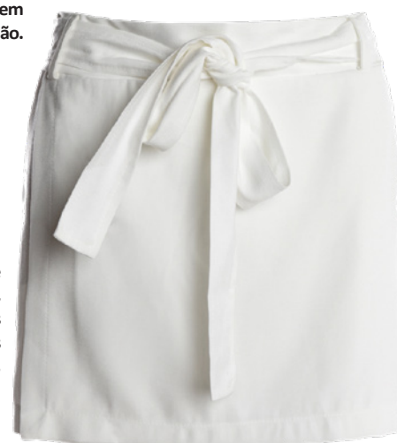
Looks leves e confortáveis, perfeitos para as confraternizações de verão.