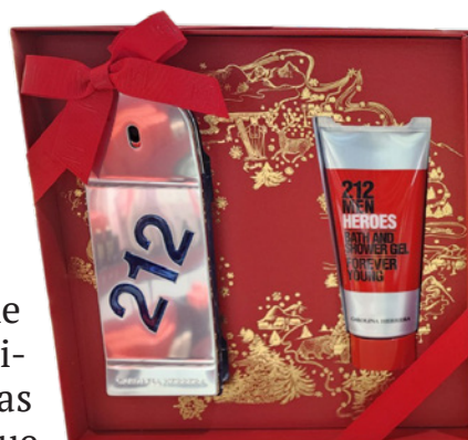
Perfumes e kits especiais, opções clássicas para presentear.

Em todos os setores, o Barão Free Shop preza pelo atendimento personalizado. A equipe está preparada para orientar o cliente e ajudar a encontrar o presente ideal, considerando gosto, necessidade e orçamento.