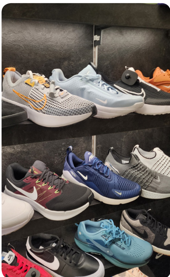
Perfeitos para praticar esportes com conforto e segurança!