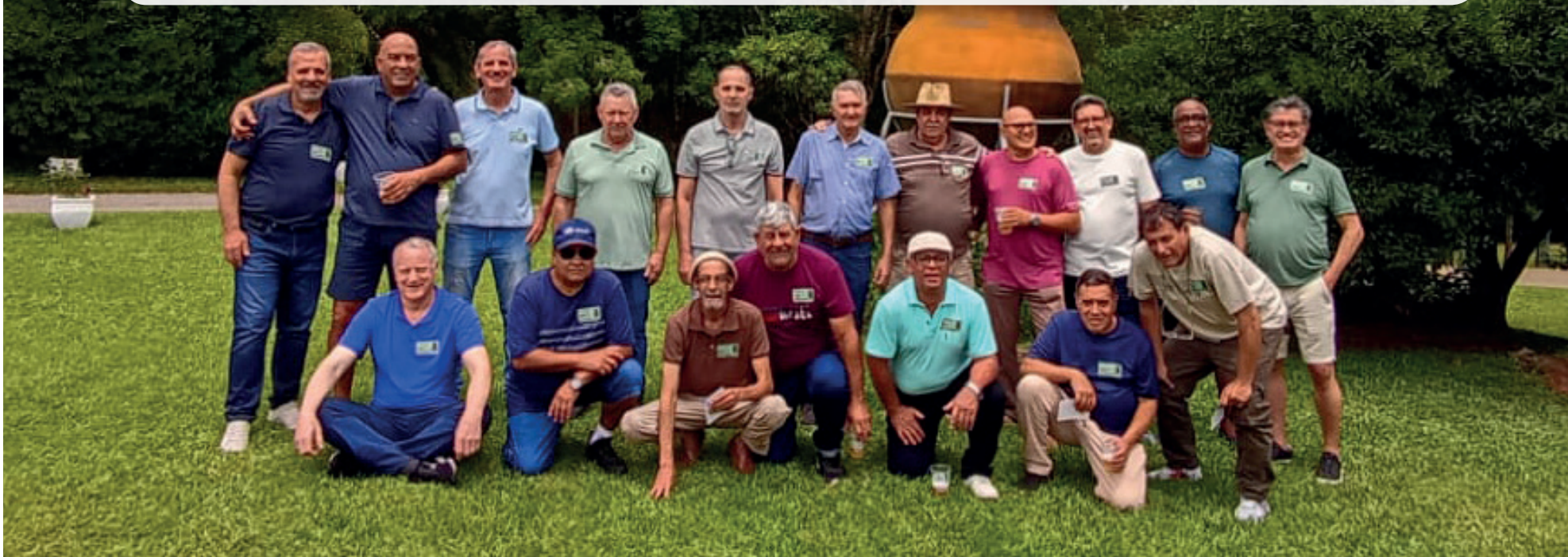
Foto: Integrantes da turma de 1978 do Esquadrão Pantera celebram reencontro em Marau.

que mantém a tradição de encontros anuais, destacou a alegria de mais um reencontro marcado pela união e pelo companheirismo preservado ao longo dos anos.