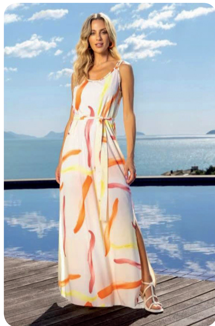
Encontre aqui o presente perfeito de fim de ano.

A Prática Modas trabalha com marcas reconhecidas, como Dockston, Wee, Lunender, Cor do Céu, Peregrino e Lisamour, reforçando o compromisso da loja em oferecer qualidade, variedade e moda acessível. A seleção especial de peças torna mais fácil encontrar o presente perfeito neste fim de ano.