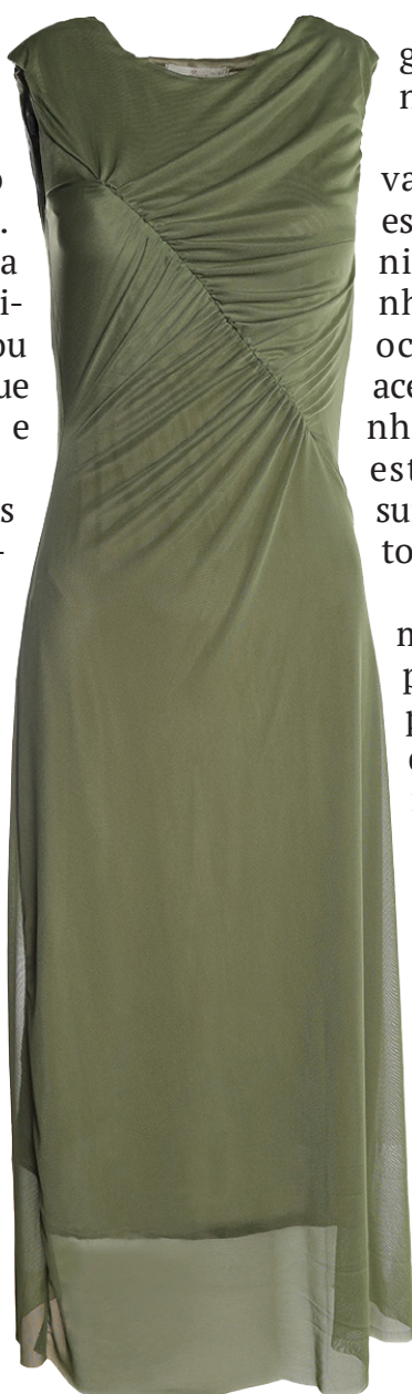
Seleção especial da Pompéia destaca combinações cheias de personalidade para as festas de fim de ano.