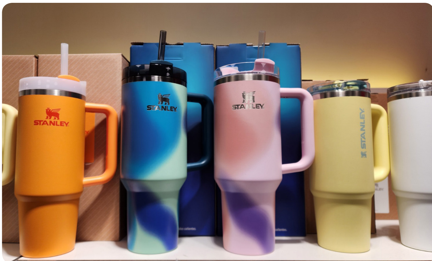
Variedade em presentes para todos os perfis.