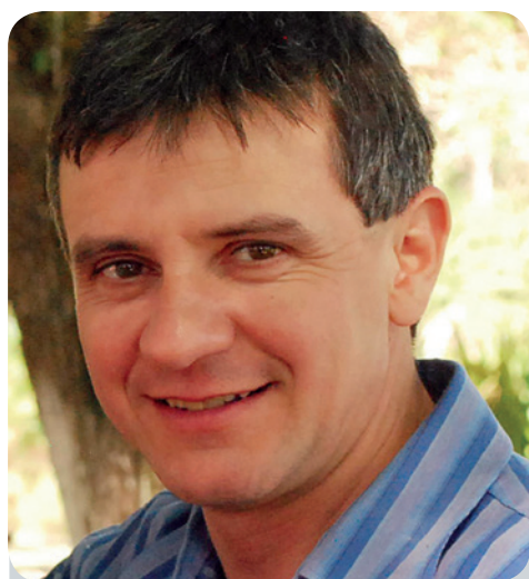
12 de dezembro