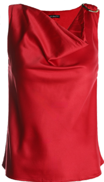
Roupas e acessórios versáteis, ideais para presentear no Natal e no Réveillon.