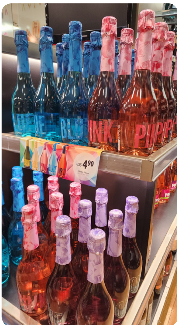
Espumantes: destaques da temporada, ideais para celebrar.

Presentes para todos os gostos no Barão Free Shop