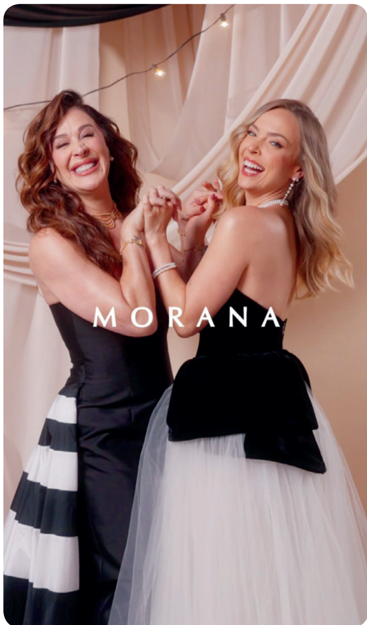
A coleção de fim de ano traz brilho, leveza e muita personalidade.

Mais do que acessórios, a Morana oferece a experiência de escolher um presente que traduza afeto. Neste Natal, a equipe recebe o público com atenção e apresenta sugestões que combinam com diferentes estilos e momentos.