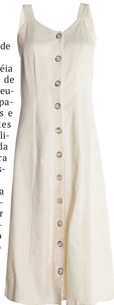
Produtos que unem moda, conforto e estilo, pensados para surpreender em qualquer ocasião.