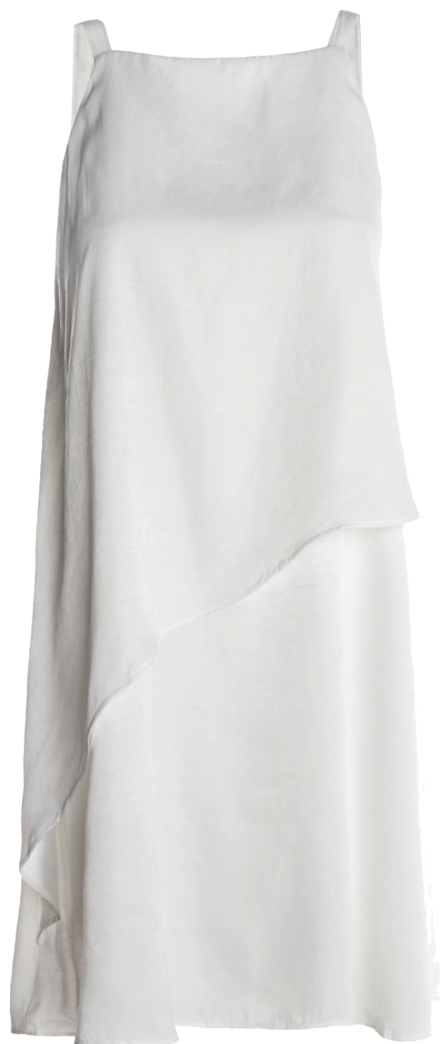
Peças da nova coleção da Pompéia, com cores e texturas que acompanham as tendências da estação.

Com essa variedade, a marca reforça seu compromisso em oferecer peças que unem qualidade e estilo, tornando mais fácil encontrar o presente ideal e celebrar as festas de fim de ano com ainda mais charme.