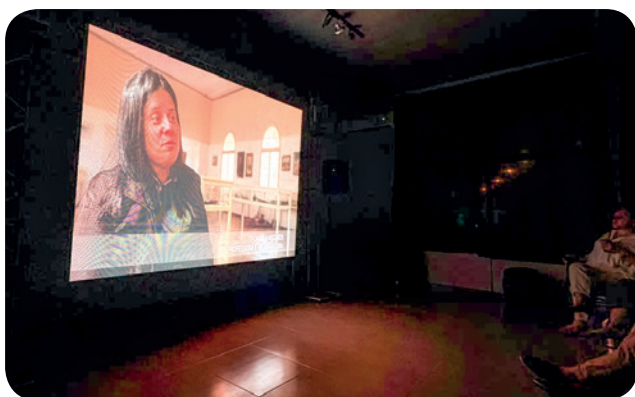
Cena do documentário mescla imagens históricas, depoimentos e recriações por inteligência artificial para recontar a trajetória dos caudilhos locais.