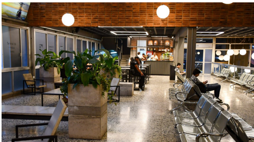
Terminal de ómnibus de Rivera

En su intervención, Sander destacó el valor simbólico y social que la Terminal representa para generaciones de