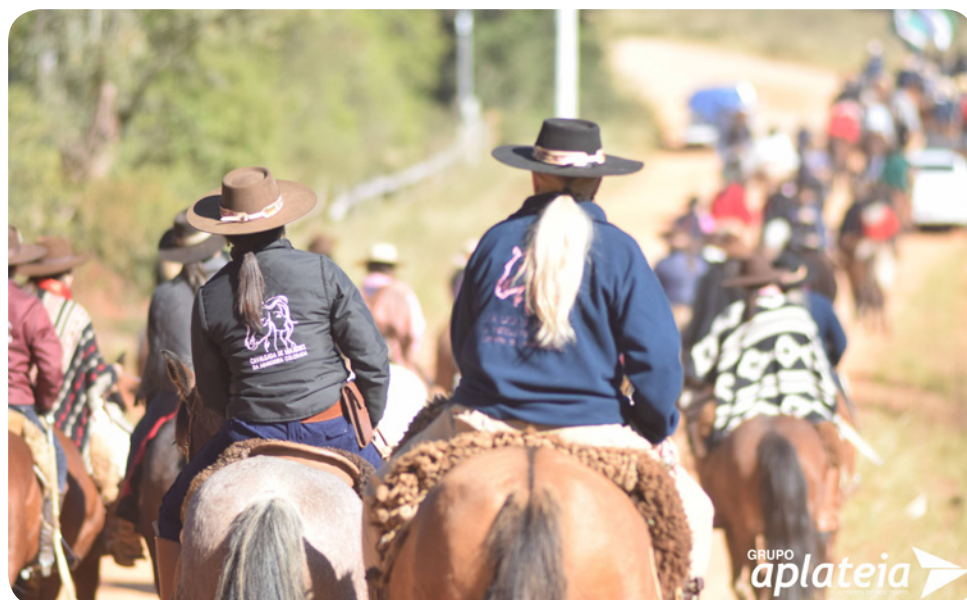
Cavaleiros e voluntários reunidos para a Cavalgada do Bem, que percorre diferentes regiões de Sant'Ana do Livramento arrecadando doações para famílias em situação de vulnerabilidade.

A concentração dos cavaleiranos e demais voluntários será às 13h30, na Caixa d'Água do Wilson, ponto de partida já tradicional do movimento. Após a formação do grupo, os participantes serão divididos em dois pelotões: um seguirá em direção ao CTGRincão da Carolina, enquanto o outro se deslocará até o Parque da Rural,