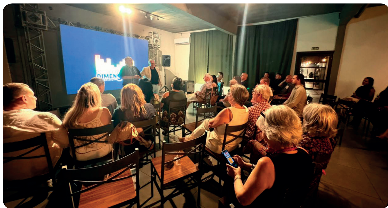
Público prestigia a estreia do filme que resgata episódios marcantes da Revolução de 1923 na Fronteira da Paz.

Para 2026, está prevista a continuidade do projeto com a Série de Televisão Os Caudilhos, em formato docudrama, com seis episódios de 52 minutos, já confirmados pela TV Brasil e plataformas de streaming de alcance nacional e internacional.