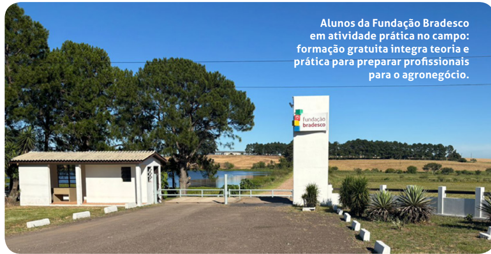
Alunos da Fundação Bradesco em atividade prática no campo: formação gratuita integra teoria e prática para preparar profissionais para o agronegócio.

O profissional formado poderá atuar em diferentes segmentos: administração e produção em propriedades rurais, instituições de assistência técnica e extensão rural, pesquisa, agências de defe-