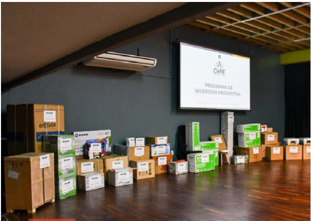
Material entregado a emprendedores